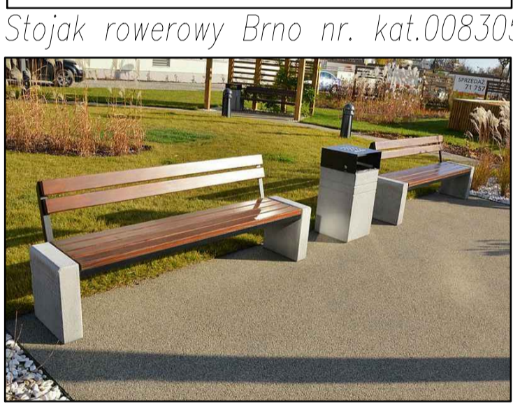
Ławka Brno nr. kat. 001316