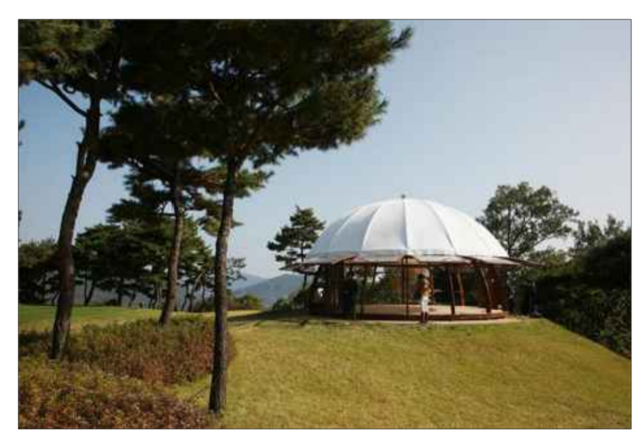
EMPIRO PAWILON LETNI 9 LUB 12 M

miejsce na sezonowe lodowisko 20x10 m ZIELONY PLAC SKWER LAKA KWIETNA